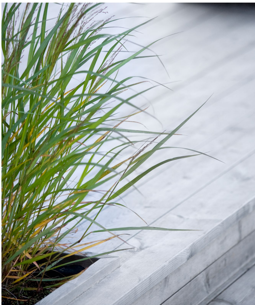
Med tiden får din kärnfurutrall en vackert grånande färg.